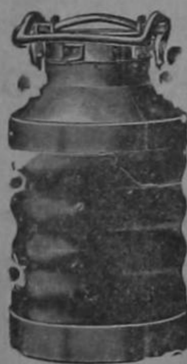
Almacenes al por mayor